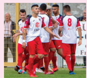
In alto la festa del Picerno dopo la vittoria con la Sarnese

Serie D Il Francavilla sbanca Sorrento Altro pareggio per il Rotonda