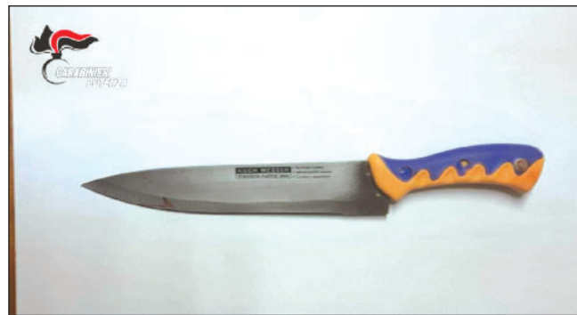
Il coltello usato dall'uomo. Salvi entrambi i coniugi grazie al tempestivo intervento del figlio e delle forze dell'ordine. A PAGINA 7

Barile, prima accoltella la moglie nel sonno poi tenta il suicidio