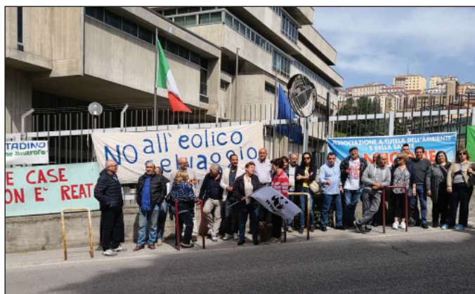
Il sit-in davanti al tribunale di Potenza. A PAGINA 14