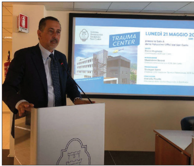
Il presidente della giunta regionale Pittelli ieri durante la firma dell'accordo al San Carlo di Potenza. A PAGINA 5

Si rafforza la vocazione dell'emergenza-urgenza: firmato l'accordo per il Trauma center