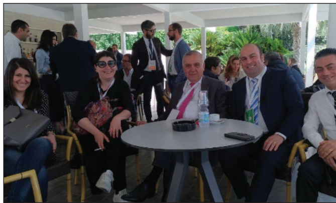
Parte della "delegazione" lucana Pd. ALLE PAGINE 2 E 3